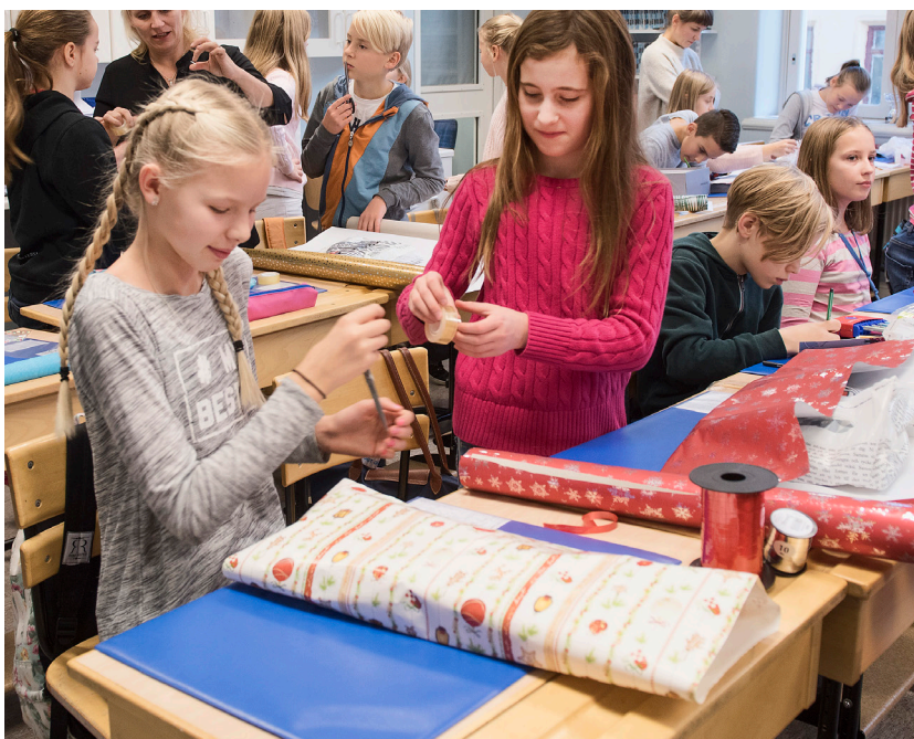
Barn i Sverige slår in julklappar och sprider glädje hos barn som inte har så mycket.

Aktion Julklappen är ett samarbete mellan hjälporganisationerna Läkarmissionen och Human Bridge. Human Bridge jobbar huvudsakligen genom att skicka biståndsmaterial till ett 25-tal länder i världen. Läkarmissionen arbetar i ett 40-tal länder för att ge utsatta människor verktyg att själva förändra sina liv.