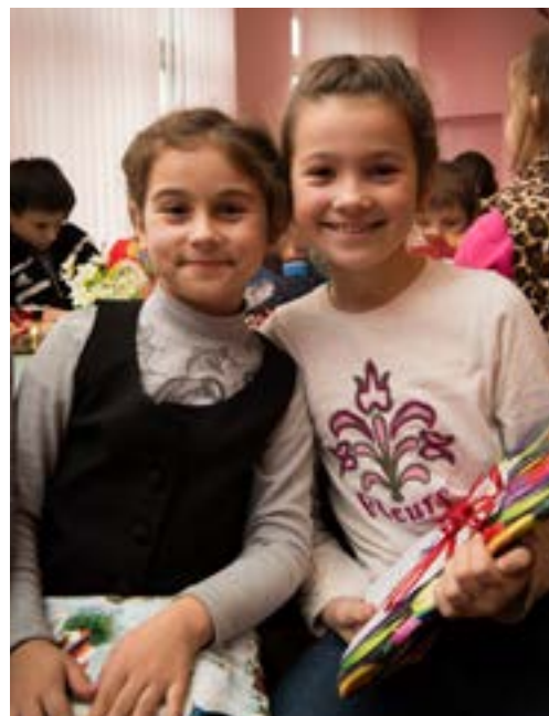
Barn från skolan i Moldavien under en julklappsutdelning 2016