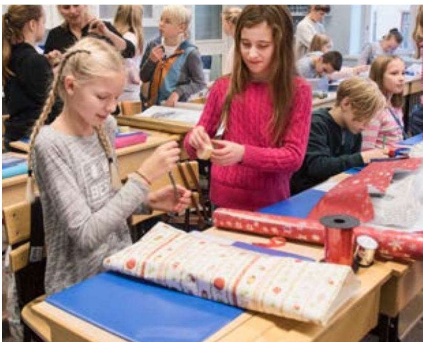
Barn i Sverige slår in julklappar och sprider glädje hos barn som inte har så mycket.

Aktion Julklappen är ett samarbete mellan hjälporganisationerna Läkarmissionen och Human Bridge. Human Bridge jobbar huvudsakligen genom att skicka biståndsmaterial till ett 25-tal länder i världen. Läkarmissionen arbetar i ett 40-tal länder för att ge utsatta människor verktyg att sjäva förändra sina liv.