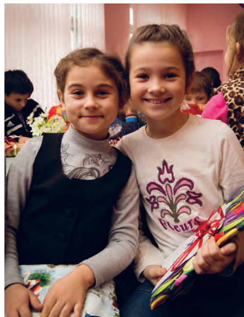
Barn från skolan i Moldavien under en julklappsutdelning 2016