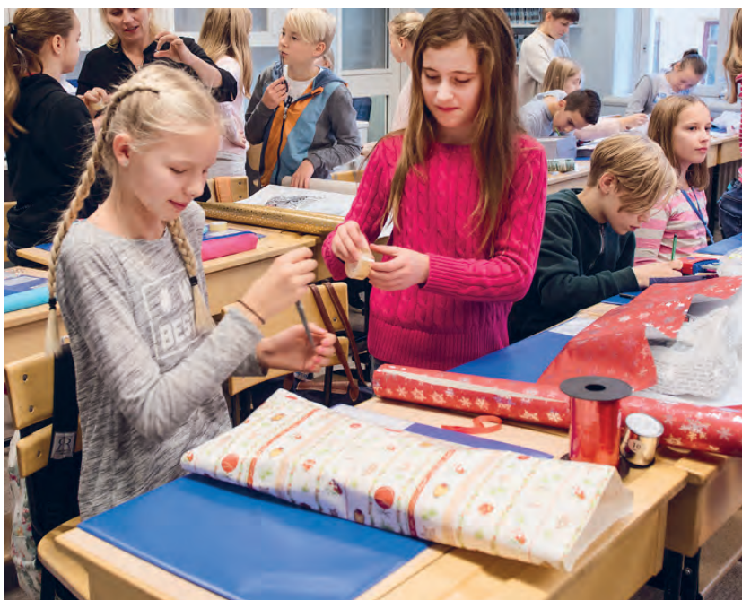
Barn i Sverige slår in julklappar och sprider glädje hos barn som inte har så mycket.

Sedan starten 1998 har mer än en halv miljon barn fått julklappar genom Aktion Julklappen. Syftet är att ge barn som inte har så mycket en gladare jul och att låta alla Julklappshjältar i Sverige få uppleva glädjen av att ge en gåva.